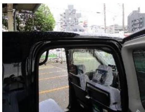
飛沫防止シートの様子