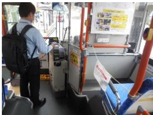
飛沫防止シート、キャッシュレス決済、 1列目座席制限の様子(路線バス)