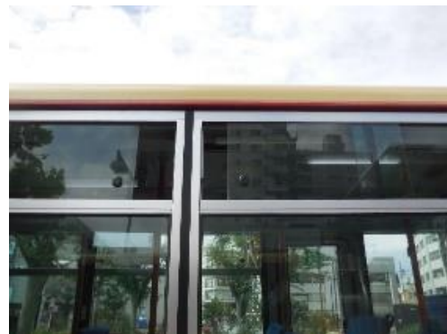
窓開け車内換気の様子(路線バス)