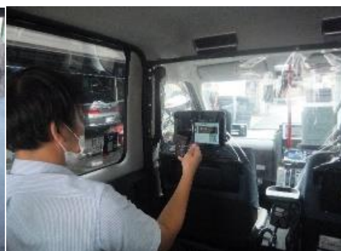
キャッシュレス決済の様子

※ なお、タクシーは、エアコン稼働下でも 約1分で空気が入れ替わります ((一社)東京ハイヤー・タクシー協会調べ)。詳細は、以下をご参照ください。