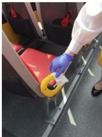
車内消毒の様子(貸切バス)